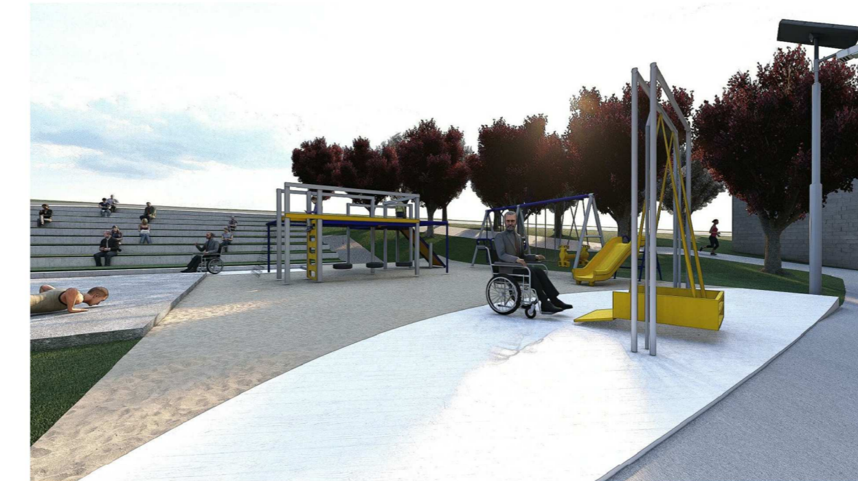
Render 04: Playground acessível e arquibancada verde sem escala