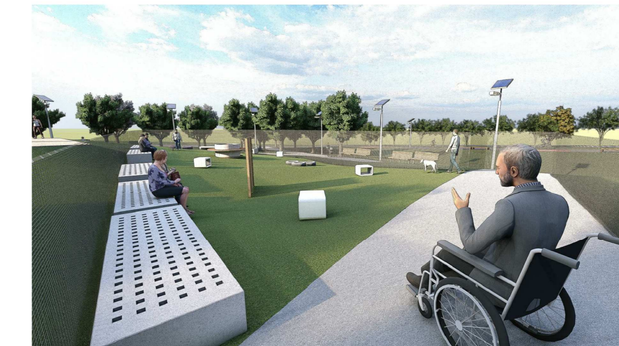
Render 07: Parcão sem escala