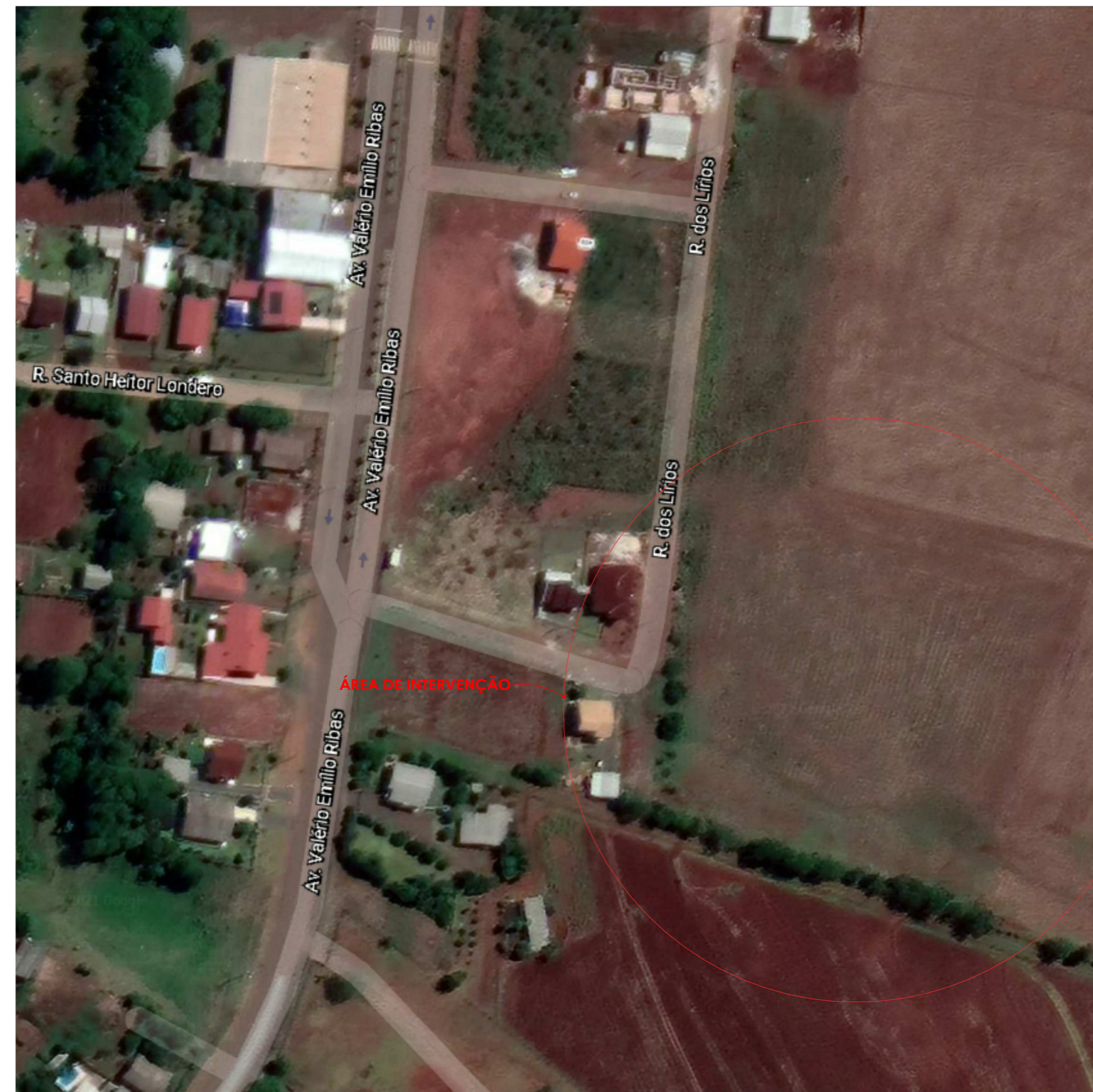
2 Localização sem escala