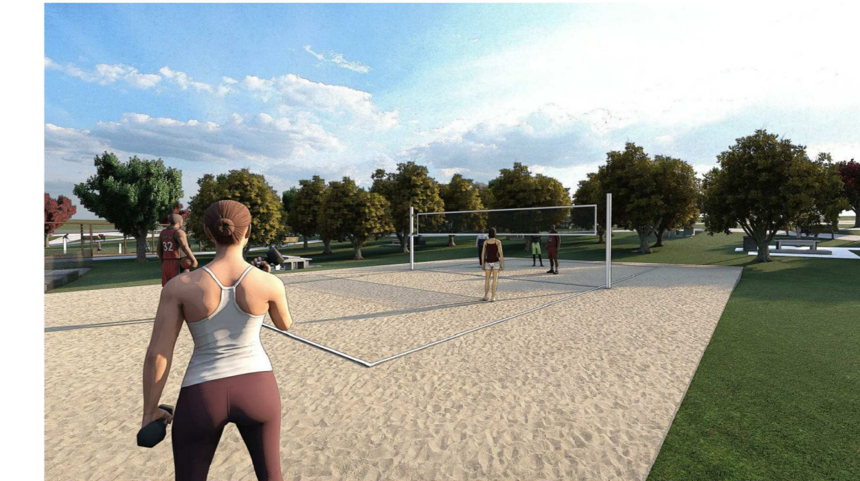
Render 05: Campo de areia sem escala