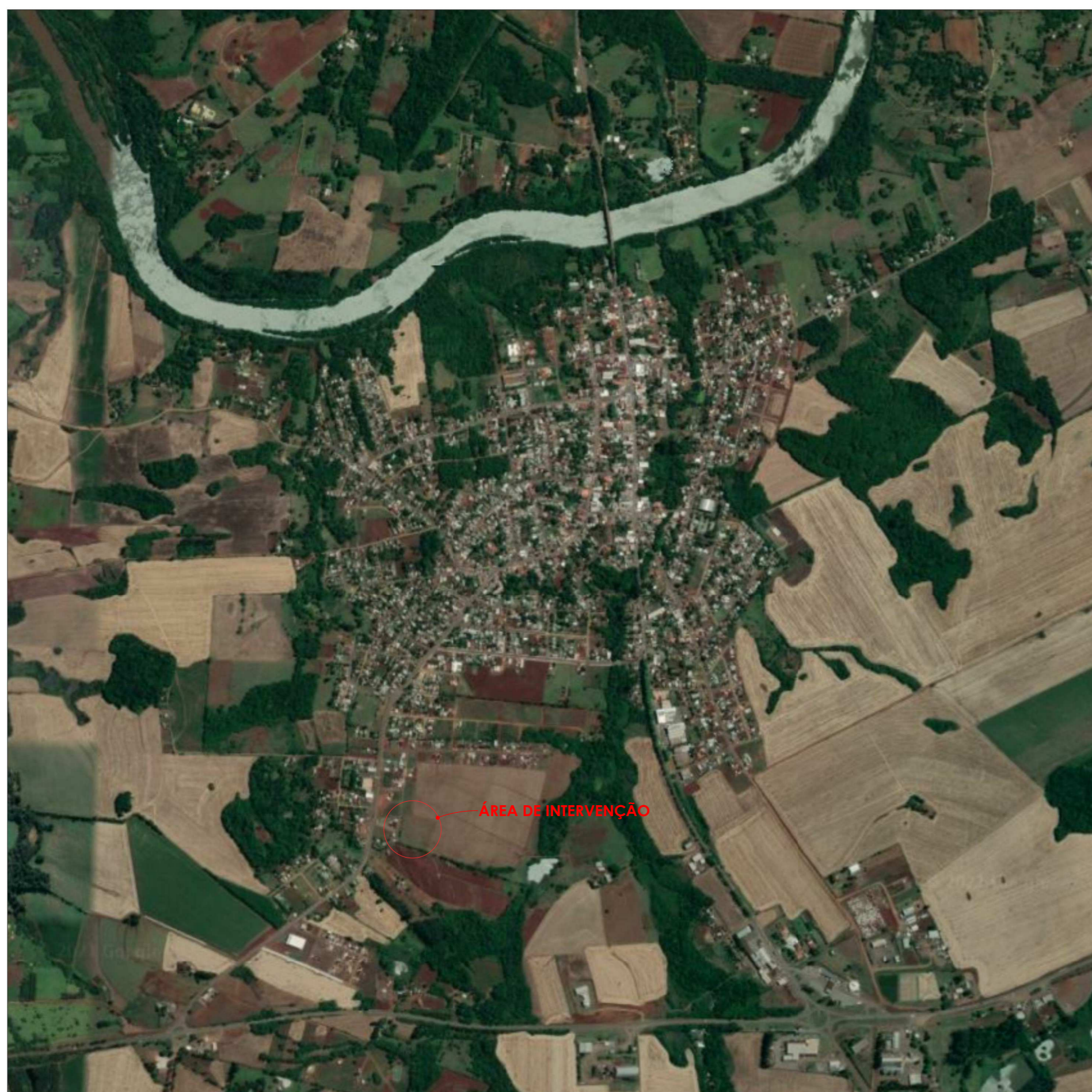
1 Localização sem escala