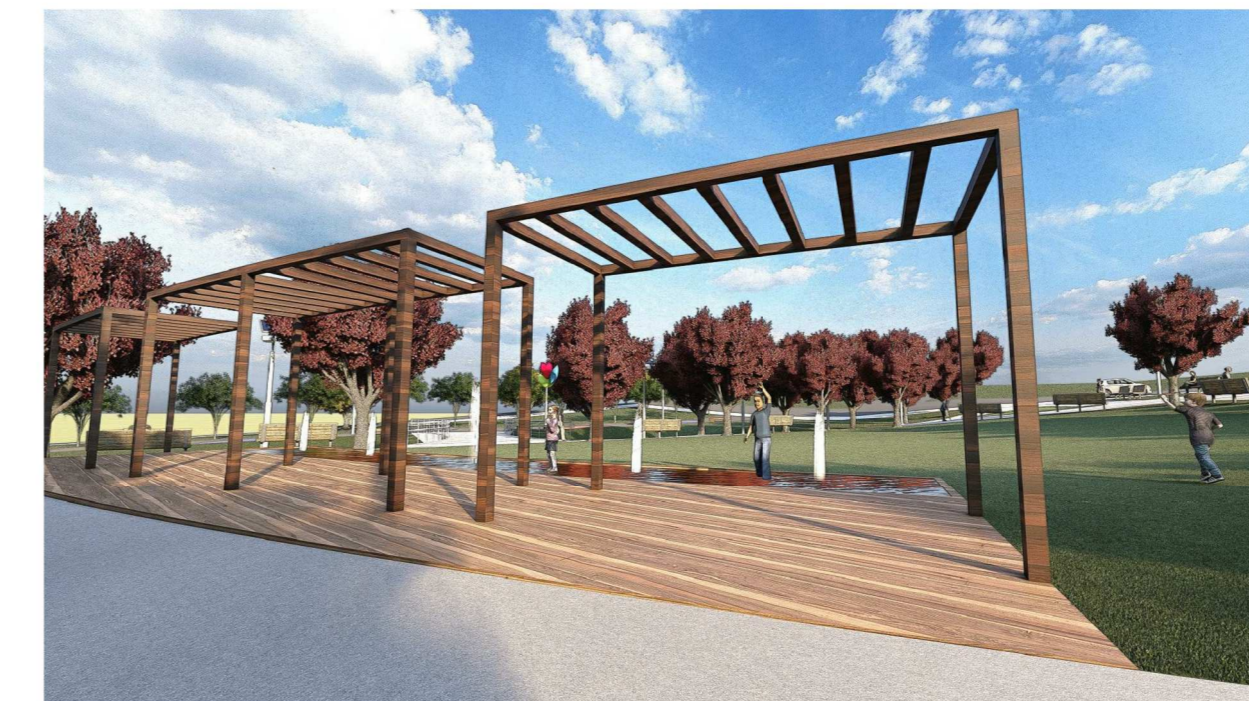
Render 06: Pergolado e lago (plataforma molhada) sem escala