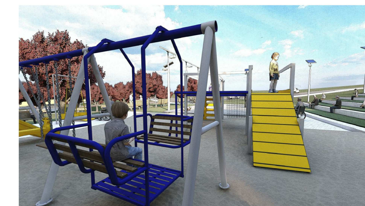
Render 03: Playground sem escala