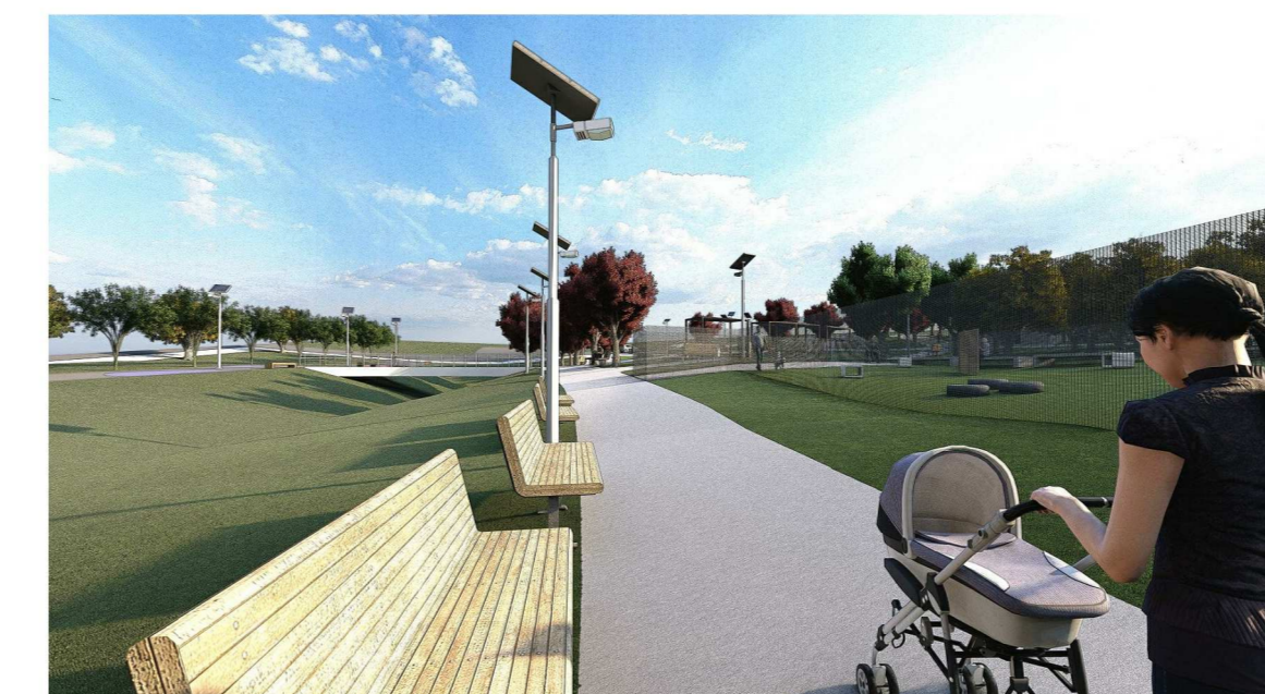
Render 08: Pergolado e lago (plataforma molhada) sem escala