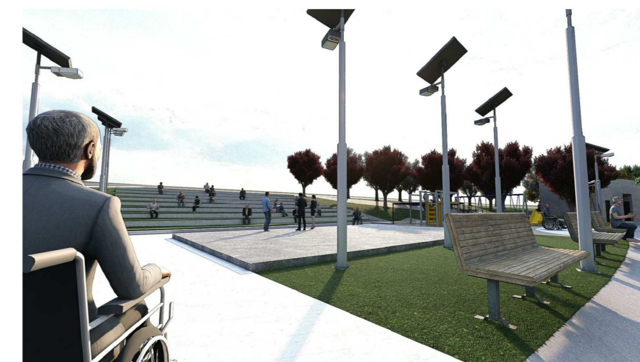
Render 02: Palco multiuso sem escala