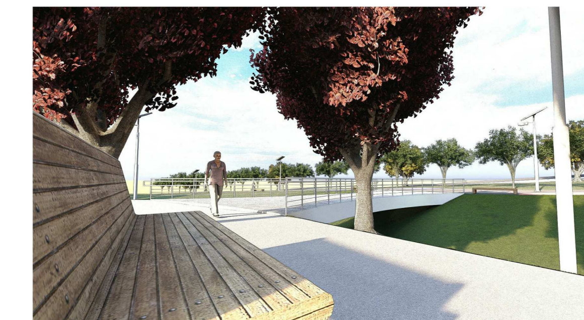
Render 09: Ponte de concreto sem escala